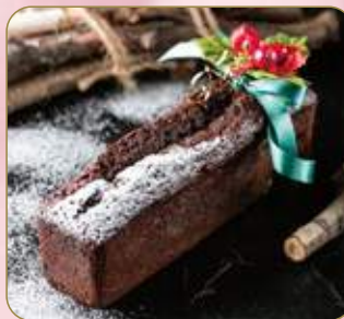
Caramel Apple Pound Cake