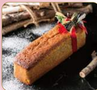
Special Blend Tea Pound Cake