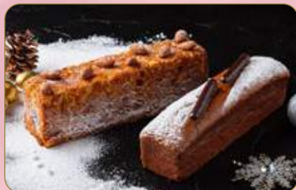
Almond Scottish Cake